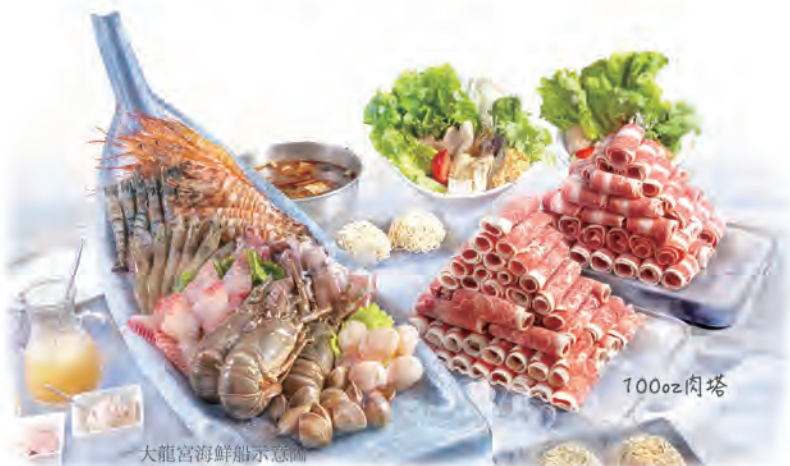
大龍宮海鮮船示意圖