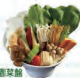
田園菜盤 隨季節不同，內容將做更換